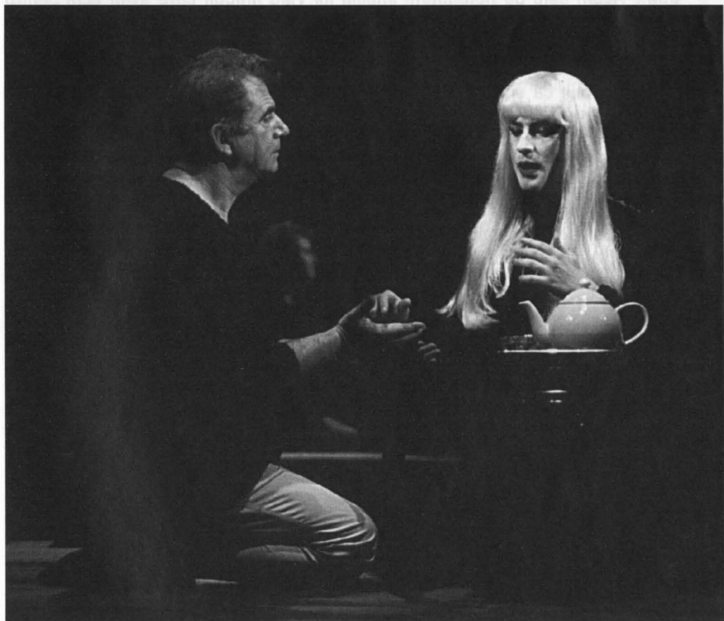
Alături de Florin Zamfirescu, în M... Butterfly de David Henry Hwang