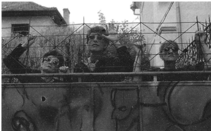
Scenă din spectacolul Jungle X