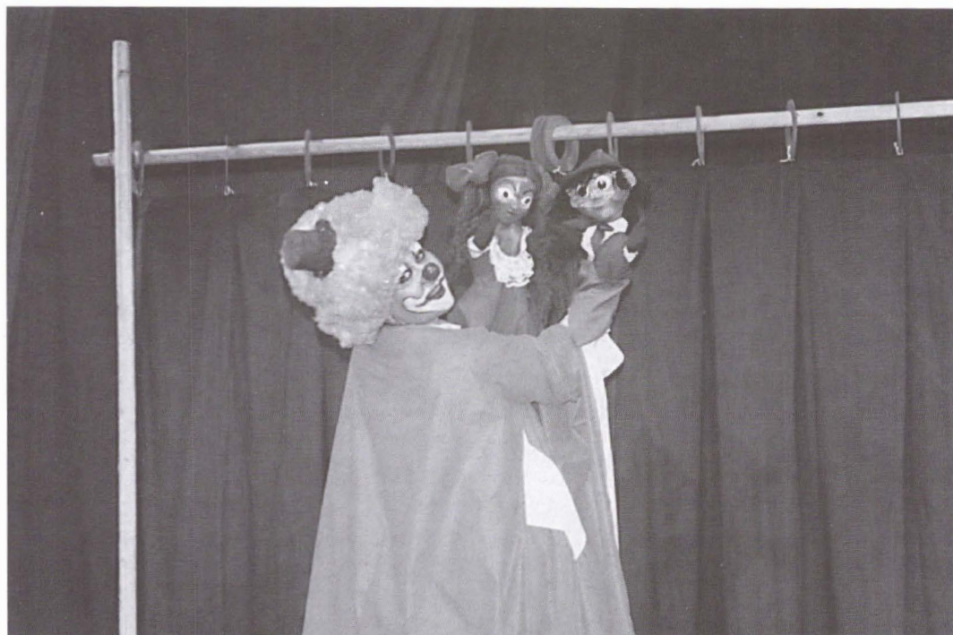
Clovnii de C. Brehnescu și Ion Agachi. Regia: C. Brehnescu.

O rază de soare de Al.T. Popescu. Regia: Toma Hogeia.