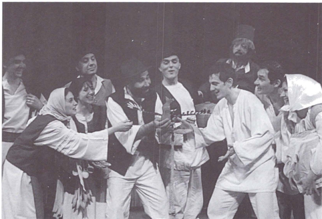
Amintiri din copilărie după Ion Creangă. Regia: Ion Cibotaru.