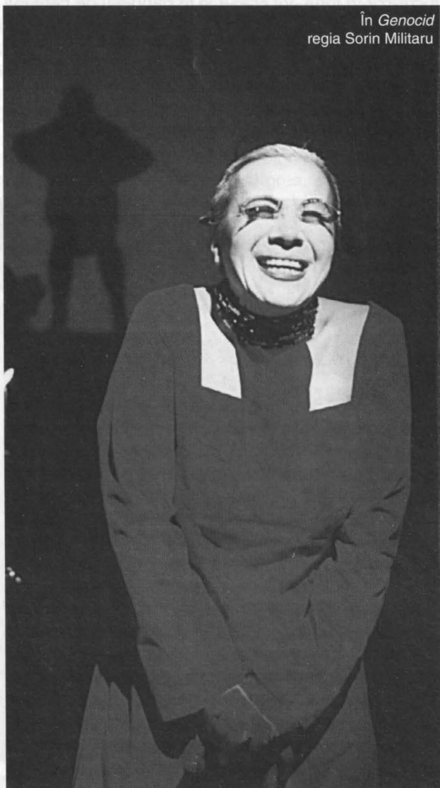
În Genocid regia Sorin Militaru

C.B.: Pentru mine, experiența a însemnat enorm. Am jucat pe mari scene ale lumii, la mari festivaluri. A fost o șansă la care n-aș fi sperat niciodată. Dar a fost și greu. Departe de a fi o producție turistică, un produs de export, cum au zis unii, eram toți foarte solicitați. Personajul îmi impunea un regim special de alimentație, de somn. Stăteam pe scenă, timp de 40 de