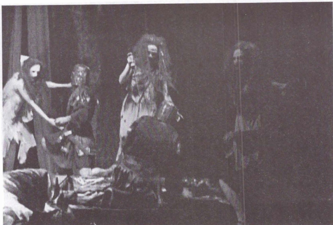
Scenă din Melissa de Kazantzakis.