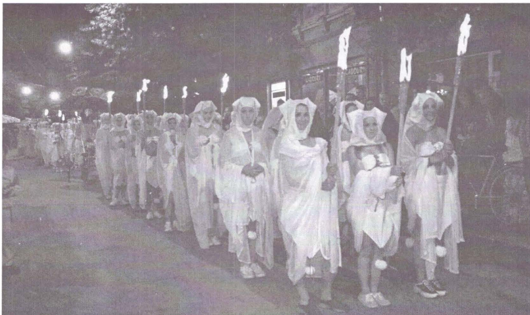
Scenă din Divina Comedie după Dante.

Includerea în rețele teatrale internaționale ori sumedenia de parteneriate cu diferite organizații au, desigur, importanța lor. Există însă riscul ca, în aluatul tot