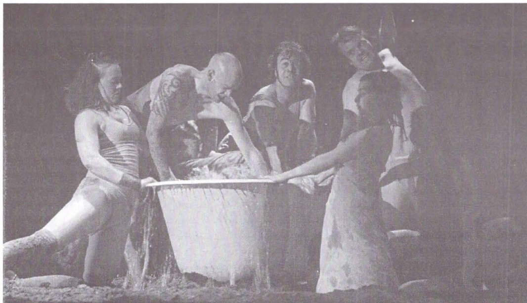
Scenă din Ferma animalelor după George Orwell.