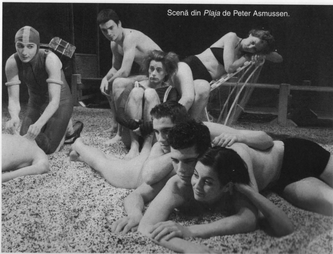
Scenă din Plaja de Peter Asmussen.