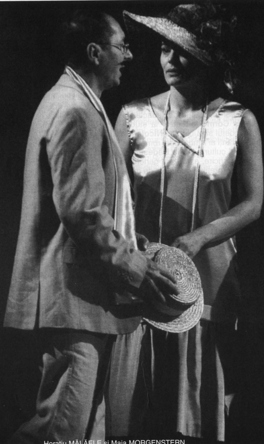
Horățiu MĂLĂELE și Maia MORGENSTERN.