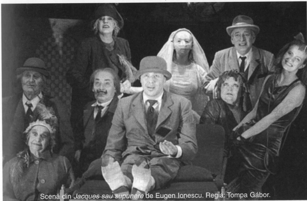
Scenă din Jacques sau supunere de Eugen Ionescu. Regia: Tompa Gábor.