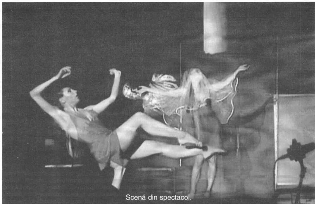
Scenă din spectacol.

Încă o premieră poate fi considerată prezența live a creației (vocal)simfonice contemporane într-o reprezentație a Teatrului de Operetă și faptul că spectatorii fideli