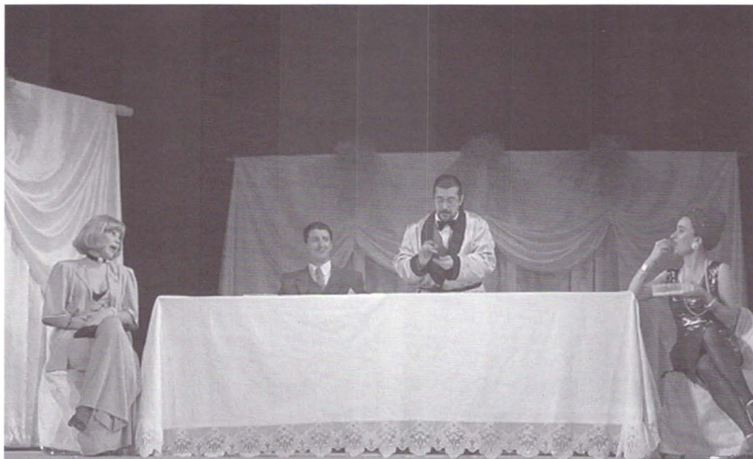
Scenă din Iluzia optică de Dumitru Solomon.