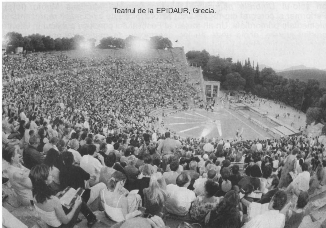
Teatrul de la EPIDAU, Grecia.