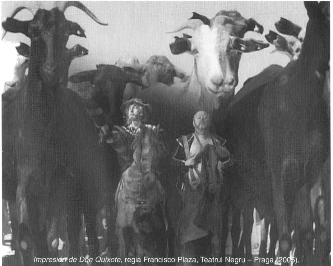
Impresión de Don Quijote , regia Francisco Plaza, Teatrul Negru – Praga (2005).