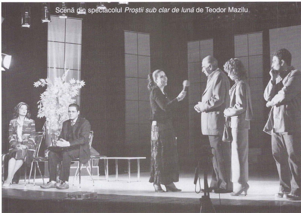
Scenă din spectacolul Proștii sub clar de lună de Teodor Mazilu.