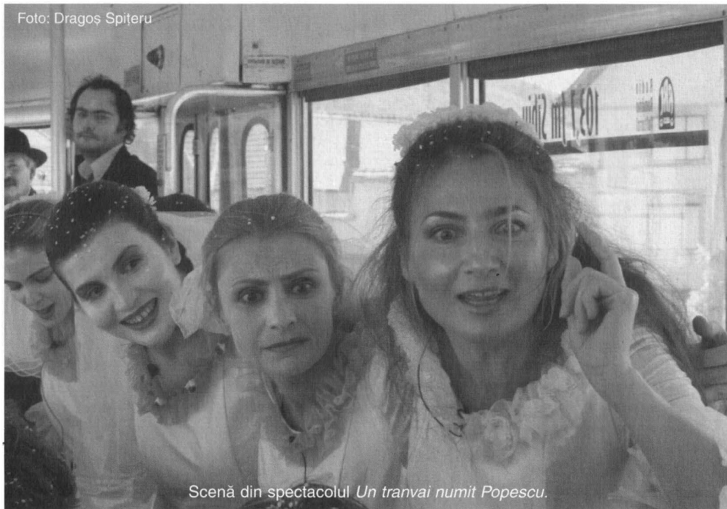
Scenă din spectacolul Un tranvai numit Popescu .

Festivalul de la Sibiu se asortează cu peisajul transilvănean. Am avut de-a face cu succesiuni deal-vale, fără piscuri, fără abisuri. În acest interval de excelență moderată, am avut destule prilejuri de a admira, de a contesta, de a reflecta.