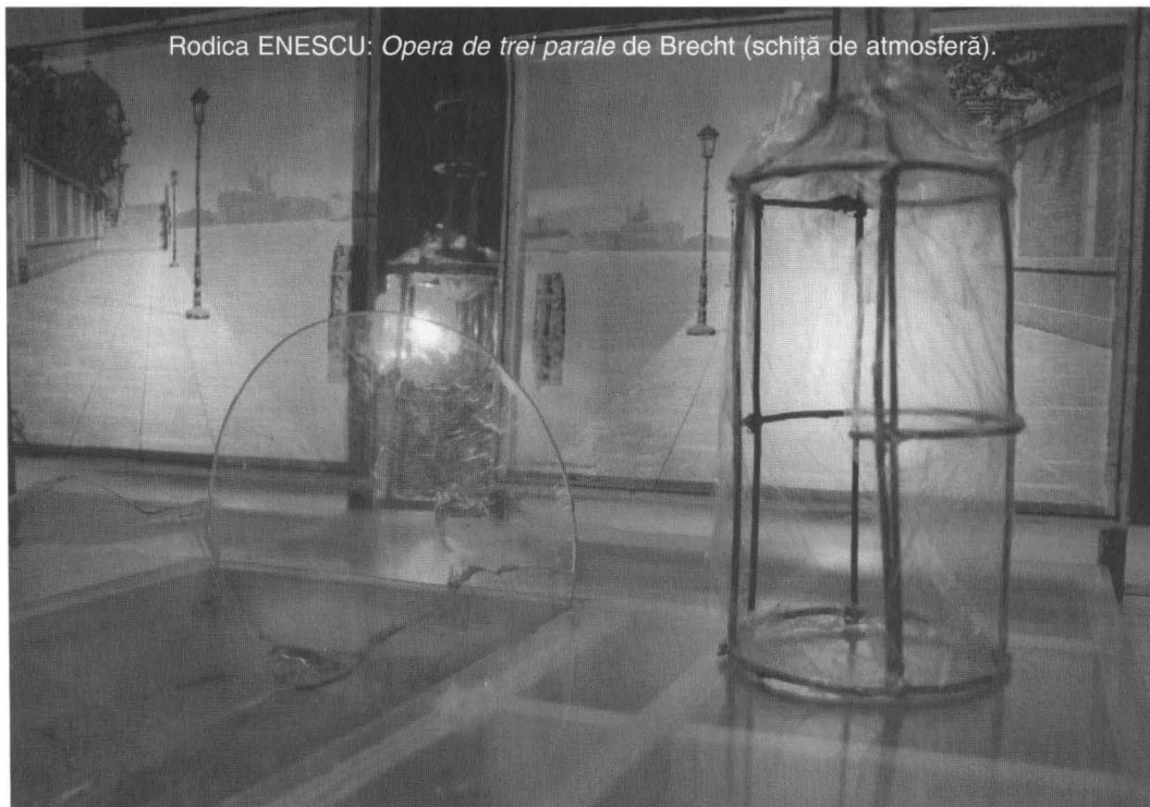
Rodica ENESCU: Opera de trei parale de Brecht (schiță de atmosferă).