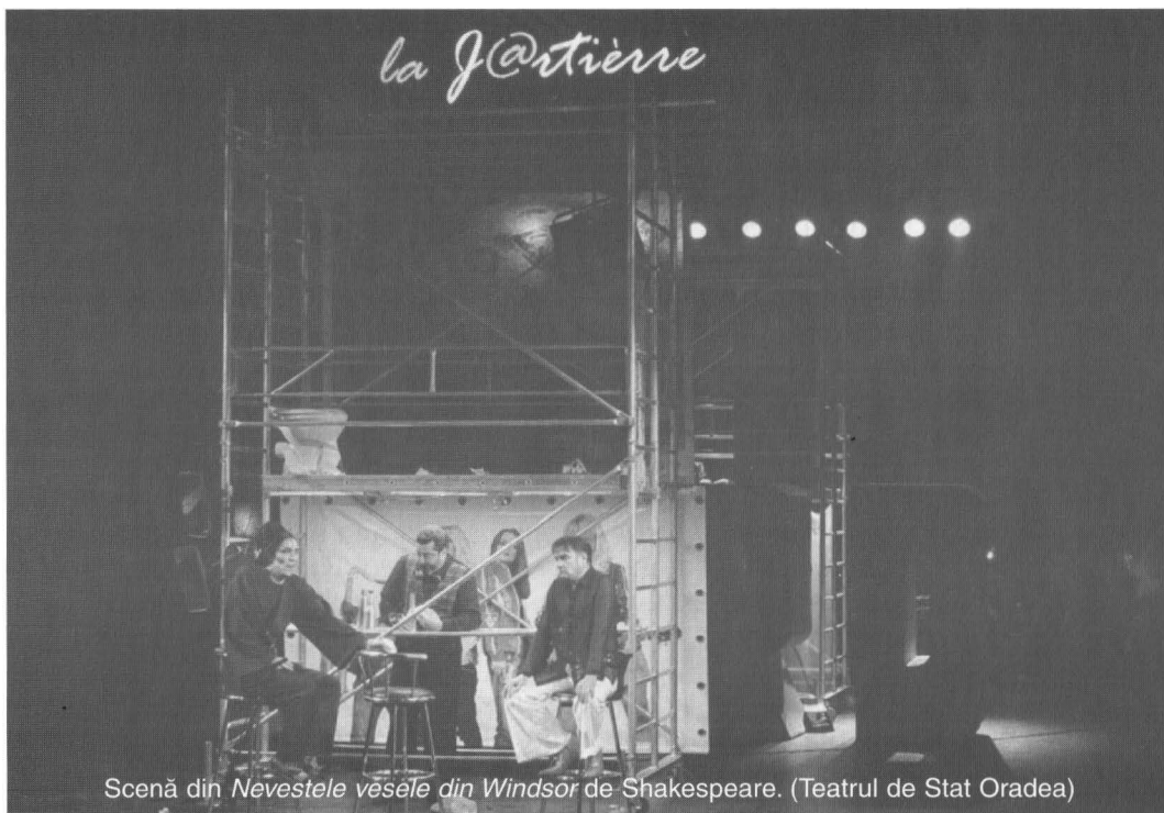
Scenă din Nevestele vesele din Windsor de Shakespeare. (Teatrul de Stat Oradea)