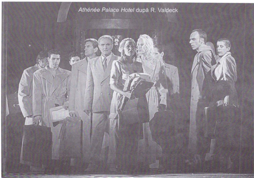
Athénée Palace Hotel după R. Valdeck