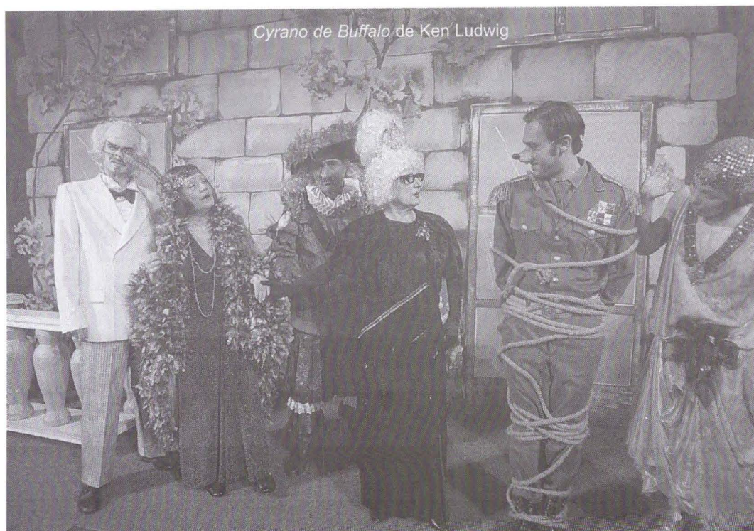
Cyrano de Buffalo de Ken Ludwig