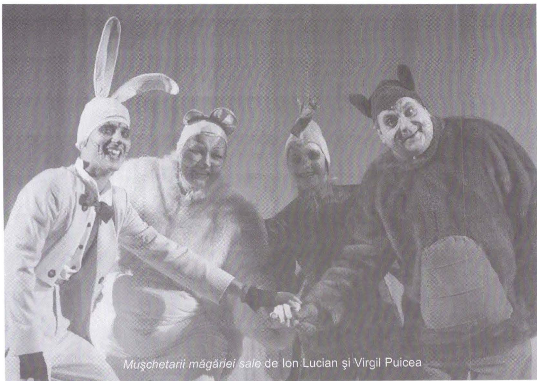
Mușchetarii măgăriei sale de Ion Lucian și Virgil Puicea