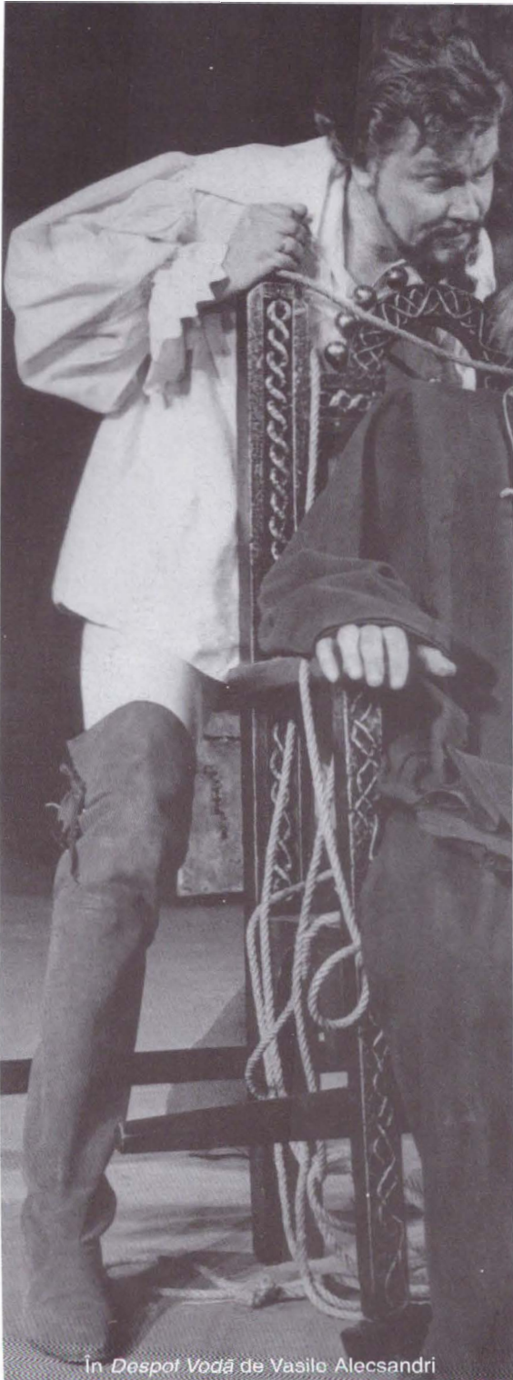
În Despot Vodă de Vasilo Alecsandri

materie, cum ar fi despre glasul și stilul actorului, sau, mai important, ca mod de înțelegere a rostului acestei meserii, „pe scenă trebuie atitudine“. Iar celălalt, grăbit pentru viața personală după stingerea reflectoarelor, dispus totuși să ia aminte și să și le însușească, cu o nedesimulată prețuire pentru colegul său. Totul se petrece în spatele cortinei, în culise și în cabina de machiaj, cu personalul tehnic la vedere, pe parcursul mai multor seri, convorbirile alternând cu scene în doi, nu neapărat de exemplificare, mai degrabă de ilustrare a condiției de artist care le cere să se desprindă de problemele personale, concentrându-se pe miza ficțiunii. Îndreptățite în general, temele abordate se produc, totuși, la un nivel comun de referință, fără a atinge un prag care să-i implice și personal, ceea ce face cam didactice comentariile. Și, mă rog, nu toate scenele sunt relevante.