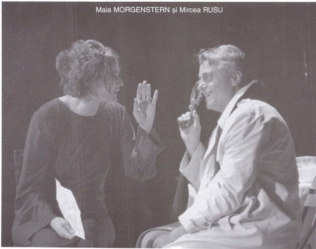
Maia MORGENSTERN și Mircea RUSU