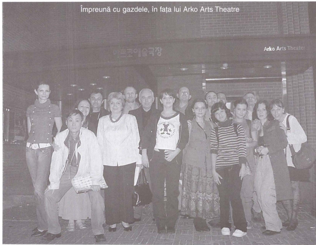
Împreună cu gazdele, în fața lui Arko Arts Theatre