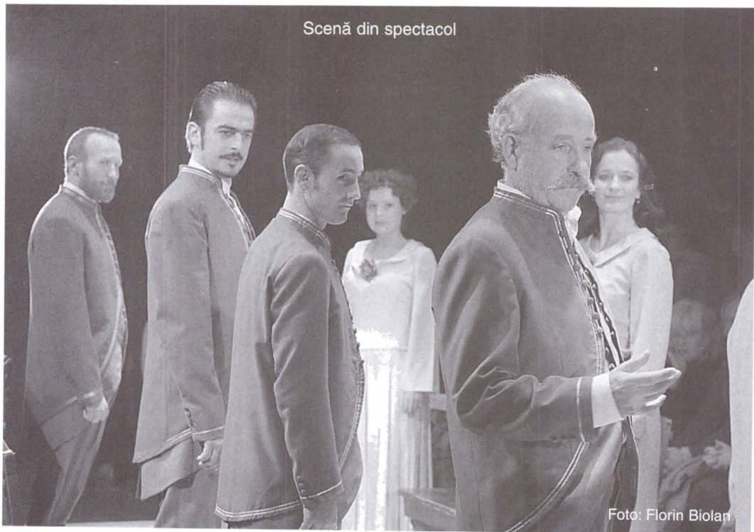
Scenă din spectacol