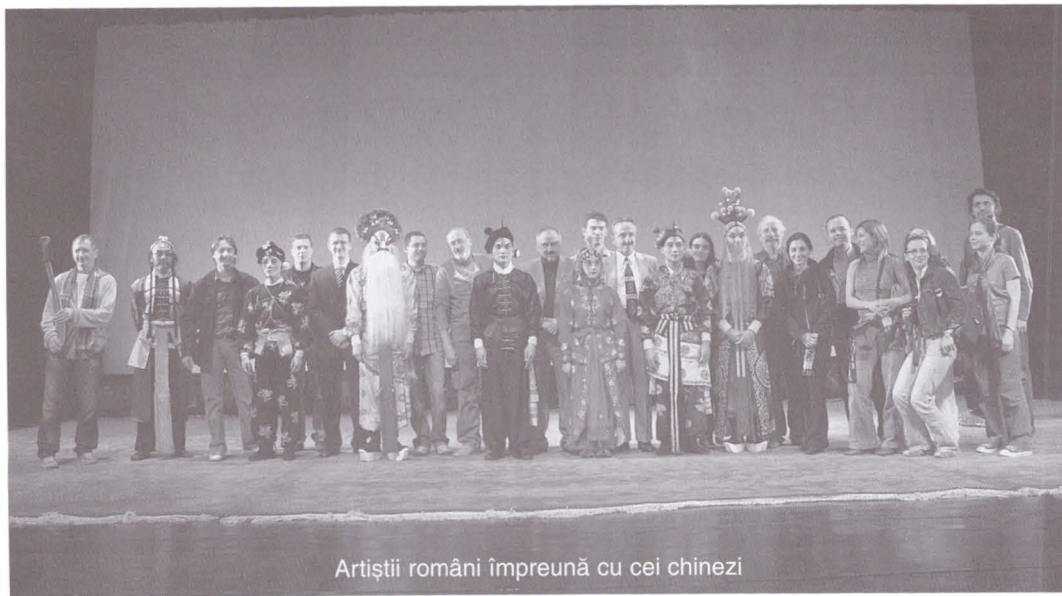
Artiștii români împreună cu cei chinezi