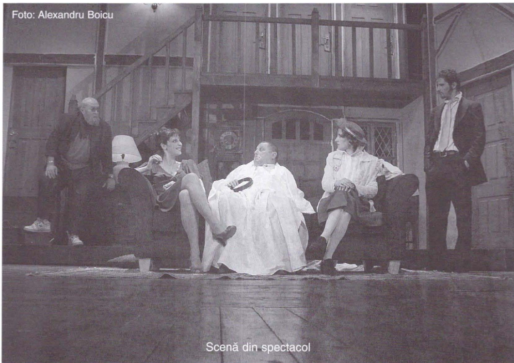
Scenă din spectacol

cum trebuie putea da totul peste cap. Rareori am văzut atâta ingeniozitate în elaborarea situațiilor, atâta precizie în mișcare și în relațiile dintre personaje și mai ales în folosirea obiectelor – care, unele, sunt la fel de importante ca și personajele și „joacă” la fel ca acestea. Există în scenă: tăvi cu sardele (care apar și dispar), telefon, sticle de băutură (ascuse de unii și descoperite de alții), buchete de flori (care trec din mână în mână producând efecte de haz), valize și serviete, o toporișcă, rochii, cearșafuri etc., fiecare cu rol precis în dezvoltarea încurcăturilor dementiale.