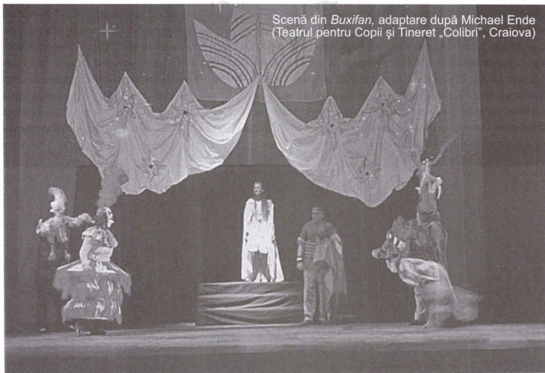
Scenă din Buxifan , adaptare după Michael Ende (Teatrul pentru Copii și Tineret „Colibri”, Craiova)

așteptai să vină cu cele mai neverosimile situații. Unele scenete alcătuiau cap-coadă o lume deformată, cu devieri de la firesc. Altele te păcăleau, desfășurându-se realist până la capăt, când, brusc, veneau cu câte o zvâcnire de absurd.