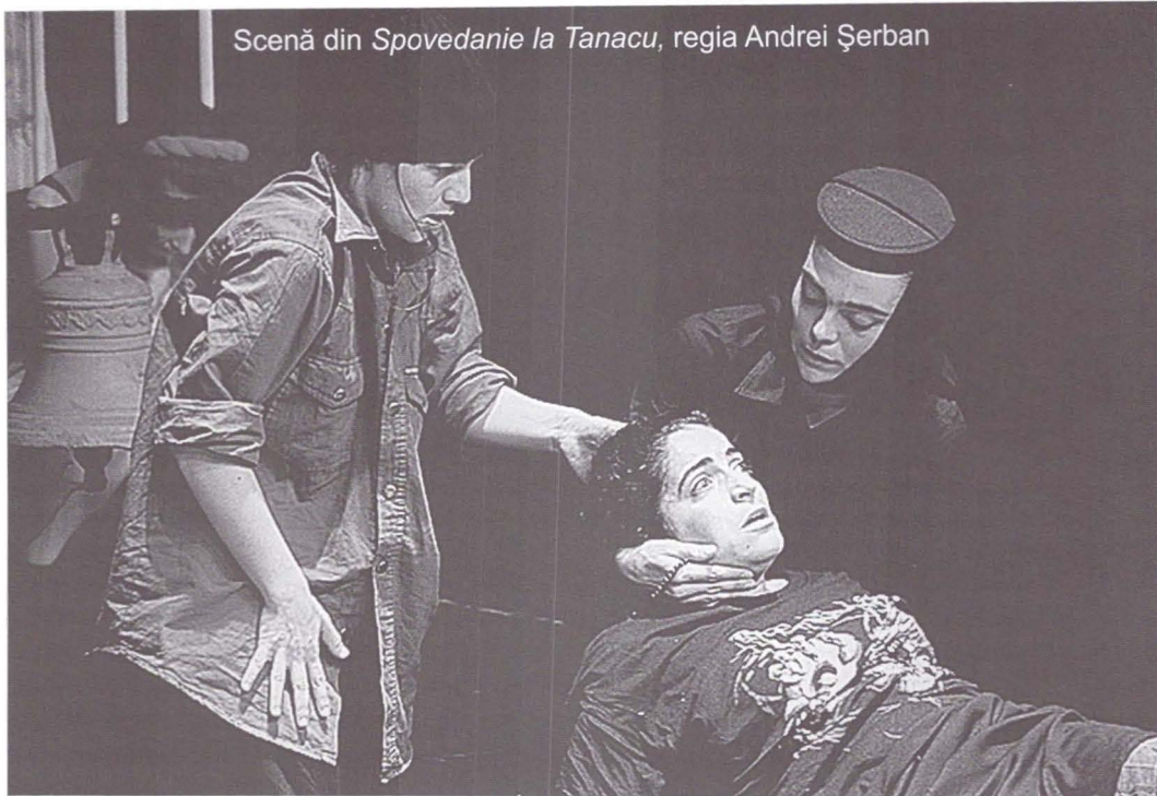
Scenă din Spovedanie la Tanacu , regia Andrei Șerban