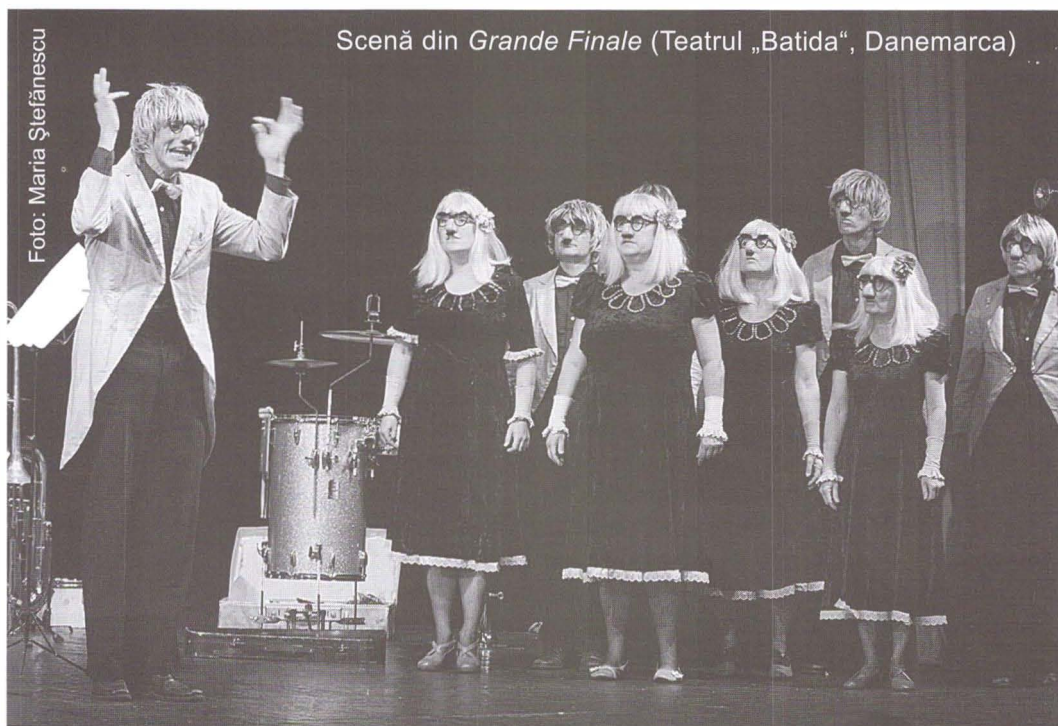
Scenă din Grande Finale (Teatrul „Batida”, Danemarca)

Organizată de către Teatrul „Ion Creangă” și Primăria Municipiului București, cu sprijinul Ministerului Culturii și Cultelor și al UNITER, în parteneriat cu TVR Cultural și Radio România Cultural, cea de-a patra ediție a Festivalului internațional de teatru pentru copii , purtând titlul semnificativ „100, 1.000, 1.000.000 de povești”, a fost întâmpinată cu săli arihpline, cu bucurii explozive din partea celor mai tineri spectatori, dar și a celor care i-au însoțit în... lumea de basm și de vis a copilăriei. Fie la teatrul-gazdă, fie în sălile Teatrului „Nottara”, ori în școlile bucureștene, unde s-au desfășurat fructuoase ateliere și work-shop-uri, maratonul artistic a cuprins spectacole foarte diferite ca mesaj și expresie scenică, oferite de trupe din România, Republica Moldova, Rusia, Danemarca, Germania, Anglia, Coreea, Belgia și Italia, dar și spectacole-lectură, pe cele mai valoroase texte din cadrul concursului de dramaturgie, toate acestea prefațate de pitorești reprezentații