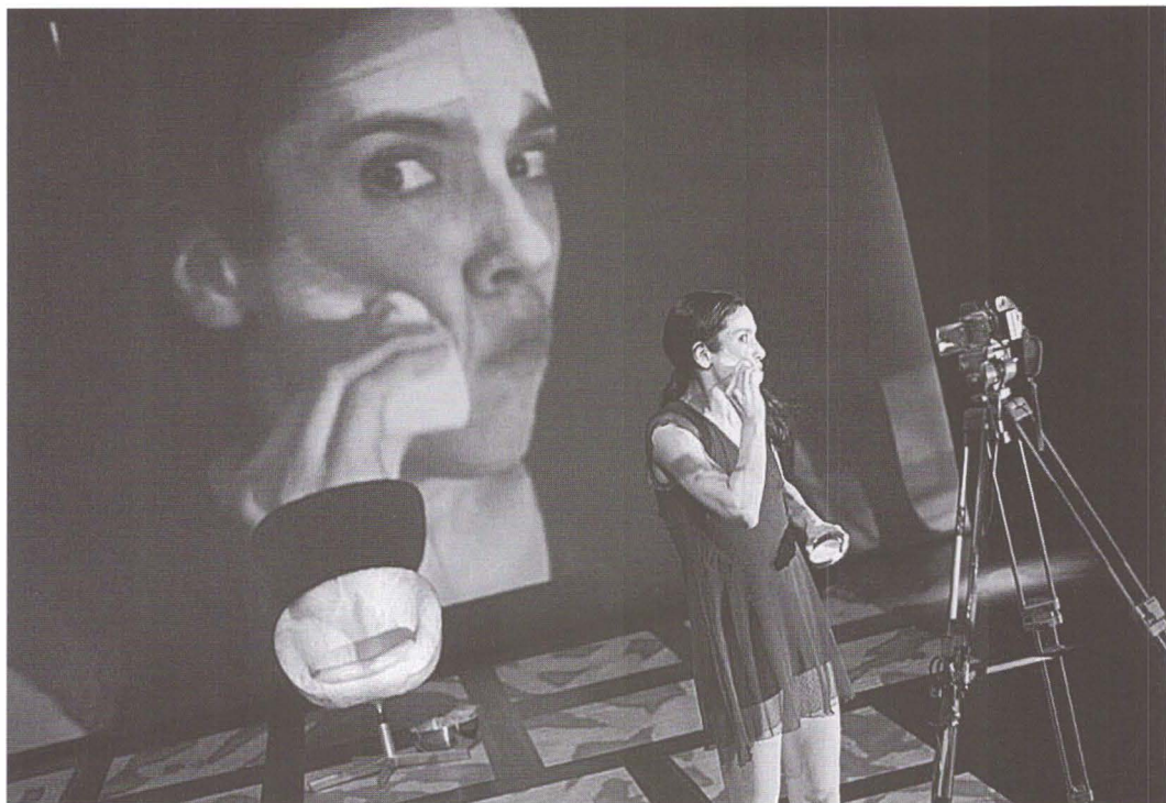
Scenă din Milkwhite / The Ritual of Disguise (ZID Theater – Amsterdam, Olanda)

A.D.: Pe cine ați invitat să susțină ateliere în 2008, care ar fi rostul acestora?