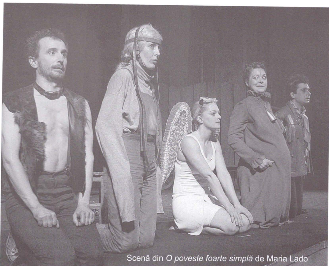
Scenă din O poveste foarte simplă de Maria Lado

regizorului adăugarea mijloacelor regizorale de lucru, chiar dacă uneori se mai taie din text!