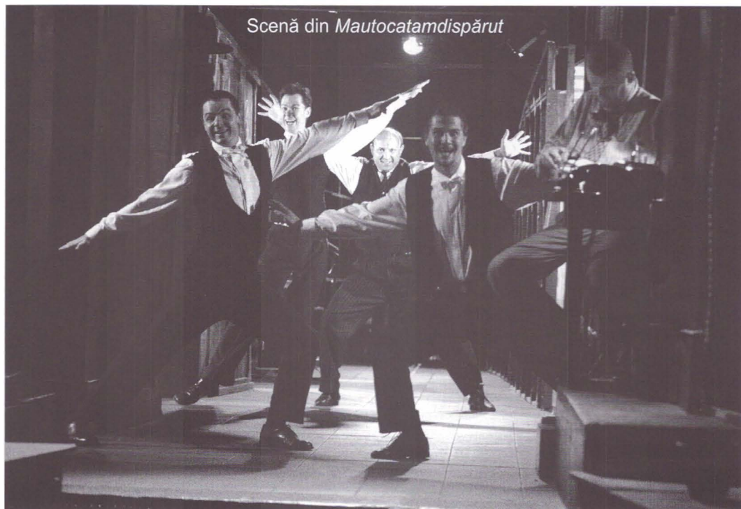
Scenă din Mautocatamdispărut

imaginate de Kafka, „vina e întotdeauna mai presus de orice îndoială“, atunci nu ne mai rămâne altceva de făcut decât să demontăm și să reasamblăm, piesă cu piesă, infernalul mecanism, absolviți cu totul de grija de a-i afla vreun misterios mode d'emploi . Cu alte cuvinte, nu ne mai rămâne decât să realimentăm până la delir (fie și unul paietat, hedonist) tortura arbitrarului. Or, la așa ceva, Bodó Viktor se pricepe de minune.