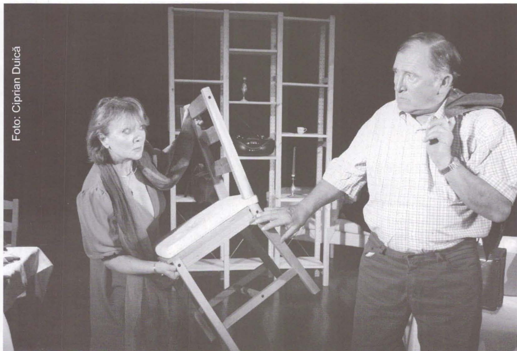
Scene din Sirena și Victoria de Aleksandr Galin