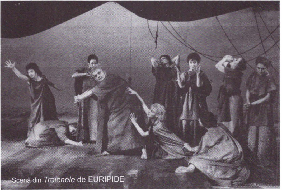
Scenă din Troienele de EURIPIDE