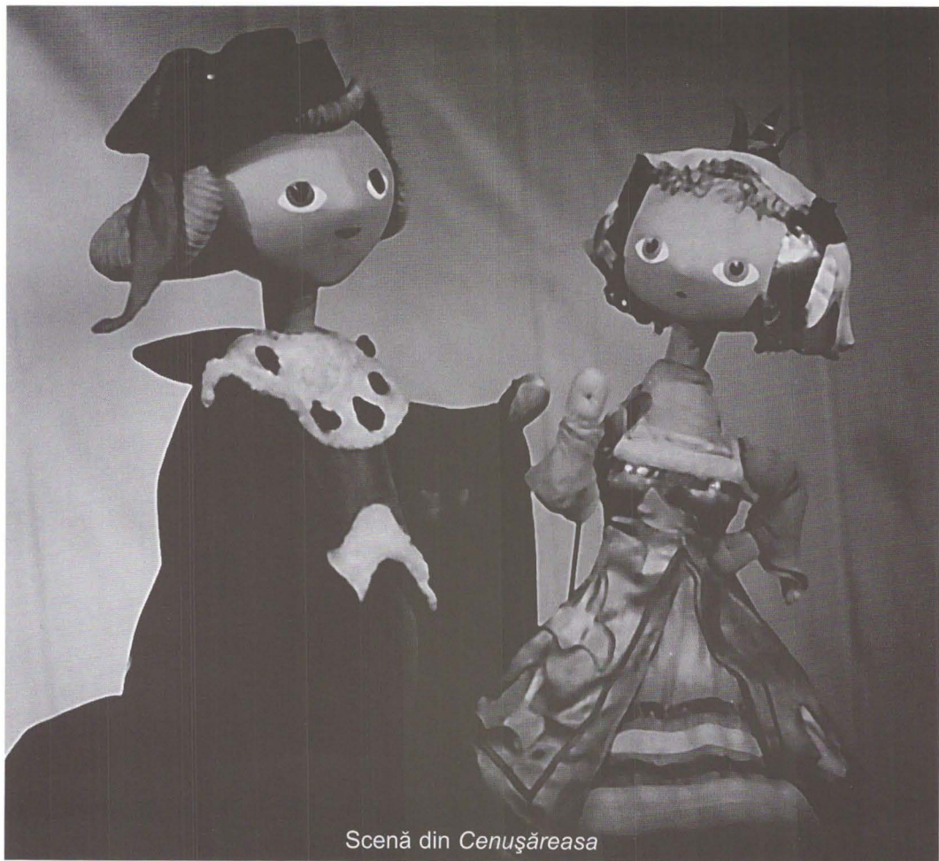
Scenă din Cenușăreasa