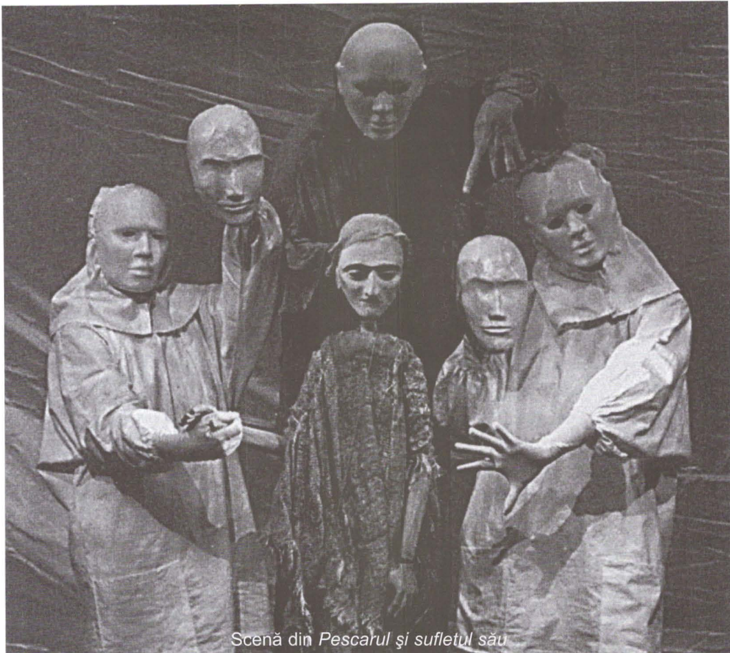
Scenă din Pescarul și sufletul său

numeroase festivaluri și obținând premii de prestigiu, diplome și ropote de aplauze ale spectatorilor mici și mari.