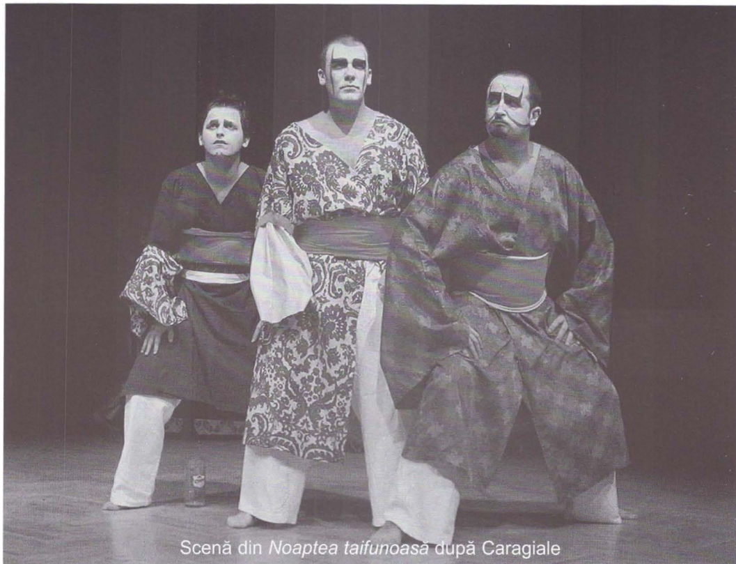
Scenă din Noaptea taifunoasă după Caragiale

legată de numărul sau vârsta actorilor, al diplomelor de licență pe cap de actor, al kilometrilor depărtare de București etc... Dar, ca să-ți răspund mai puțin eseistic, imediat după ce terminăm interviul, plec acolo și montez un Vișniec.