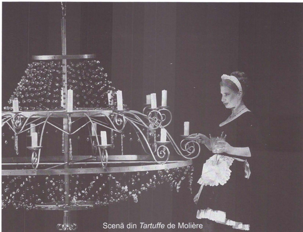
Scenă din Tartuffe de Molière