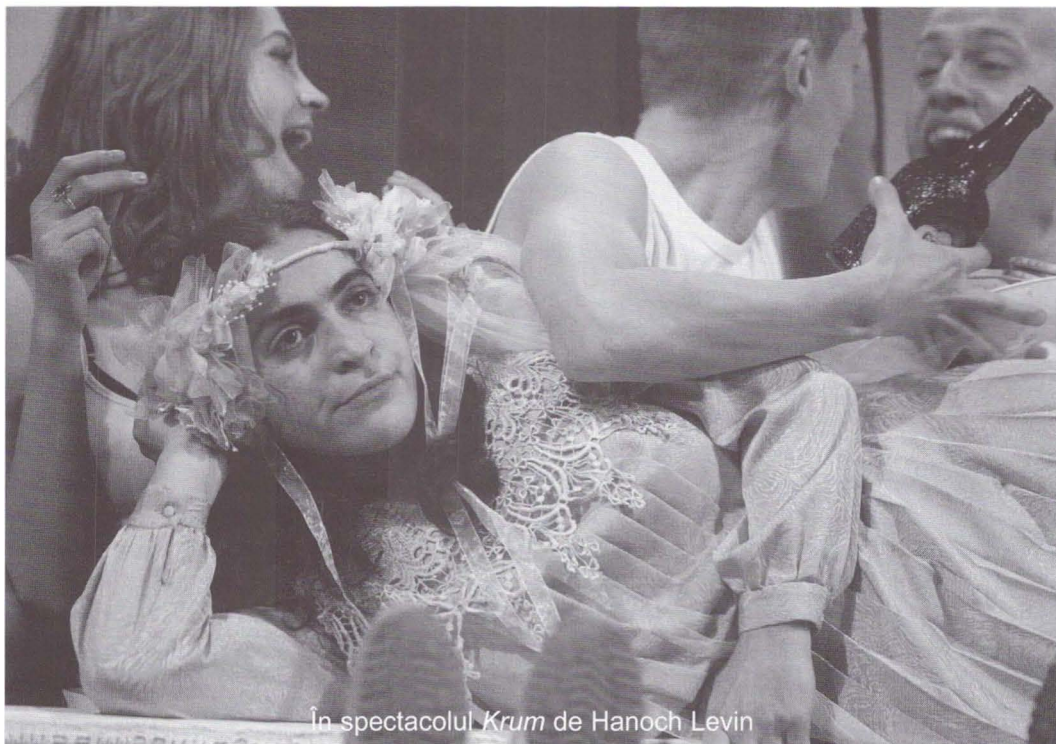
În spectacolul Krum de Hanoch Levin