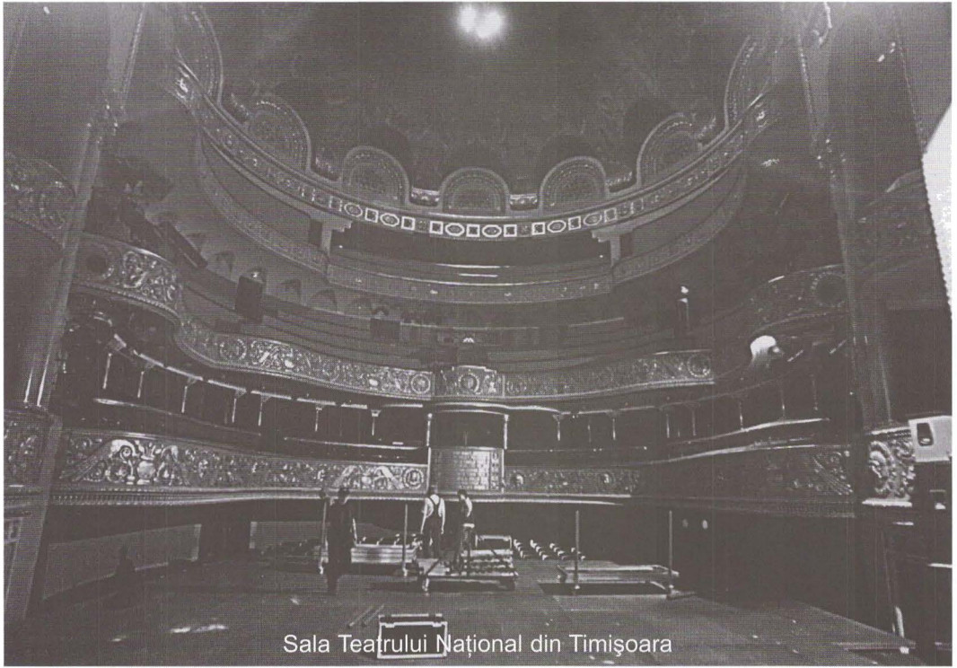
Sala Teatrului Național din Timișoara