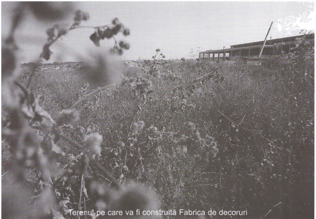
Terenul pe care va fi construită Fabrica de decoruri