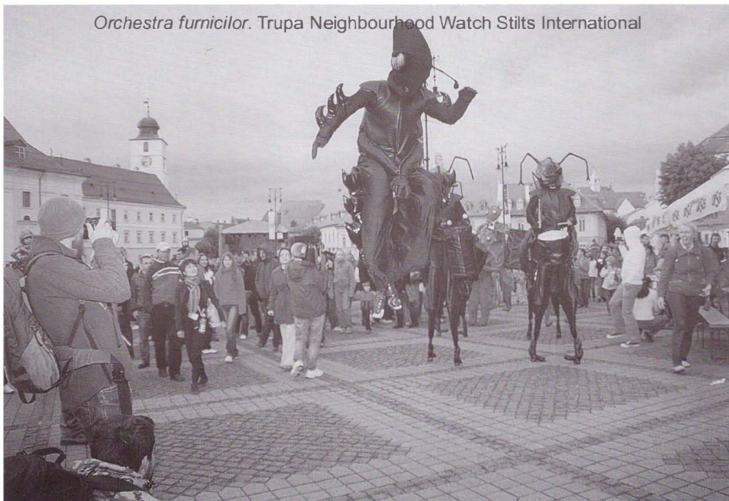
Orchestra furnicilor. Trupa Neighbourhood Watch Stilts International