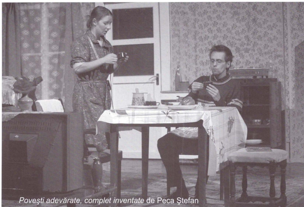
Povești adevărate, complet inventate de Peca Ștefan