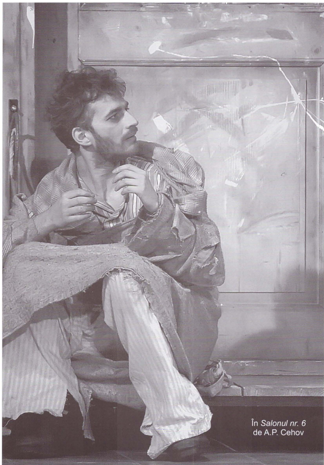
În Salonul nr. 6 de A.P. Cehov