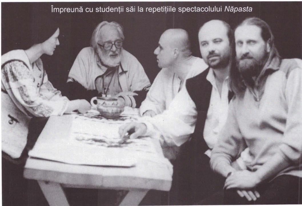
Împreună cu studenții săi la repetițiile spectacolului Năpasta

C.Ĉ.: Câteodată, da, câteodată, da!!! Poate și egoismul meu, care a fost mai crâncen decât aș fi avut dreptul sau aș fi dorit. Există momente, în care fiecare își urmărește interesul cu sălbăticie.