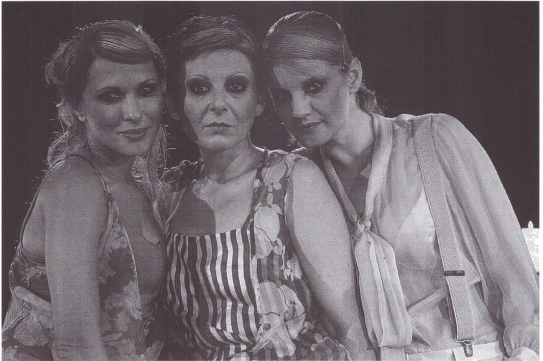
Trei surori de A.P. Cehov