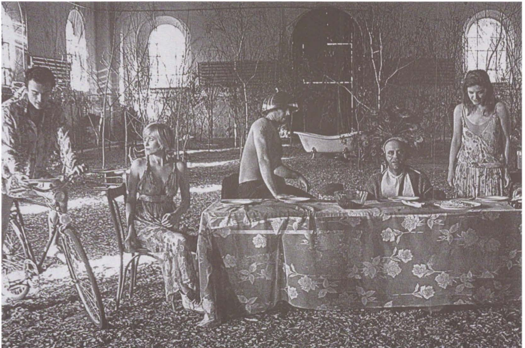
Boala familiei M de F. Paravidino