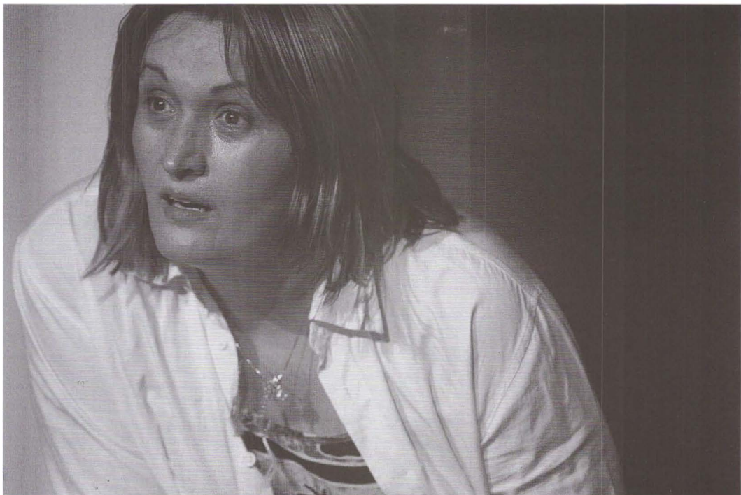
Copilul din spatele ochilor de Nava Semel