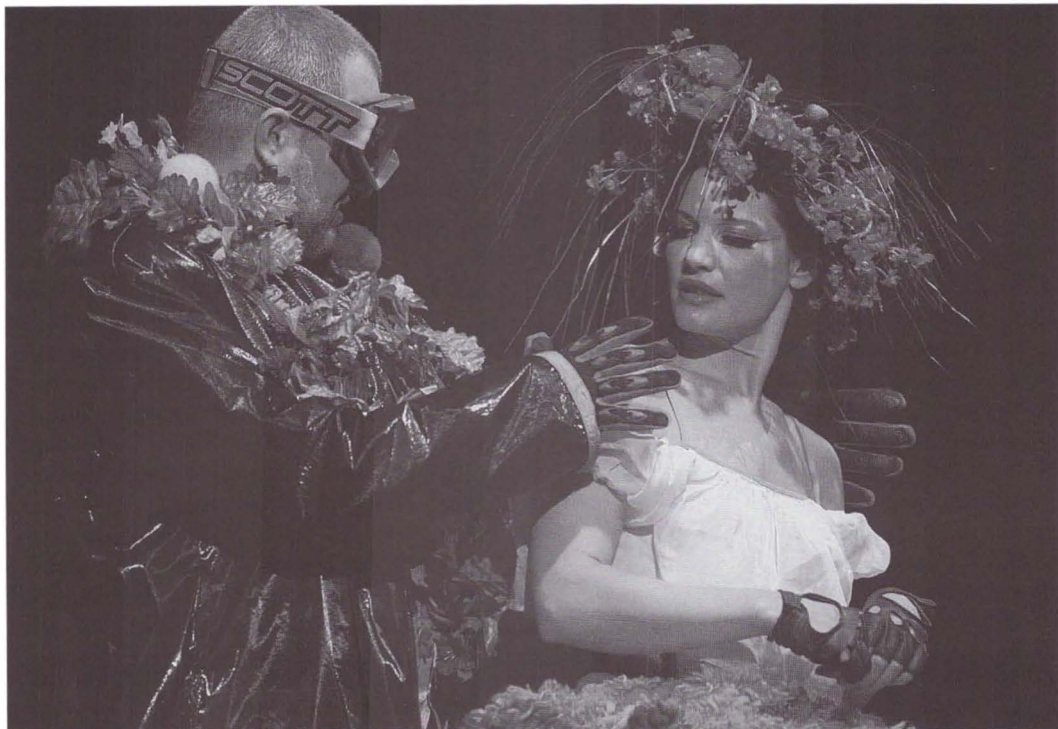
Povestea de iarnă, după Shakespeare