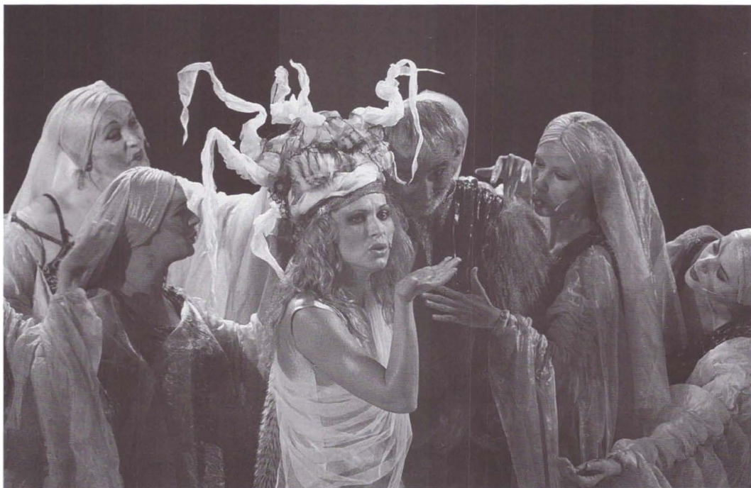
Norii de Aristofan