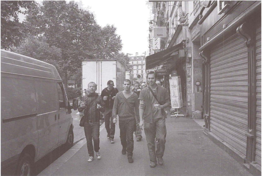
În turneu la Paris