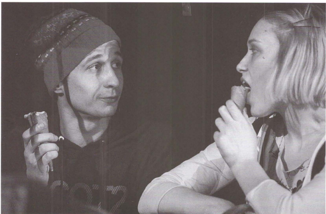
Bye Bye America de Carmen Dominte