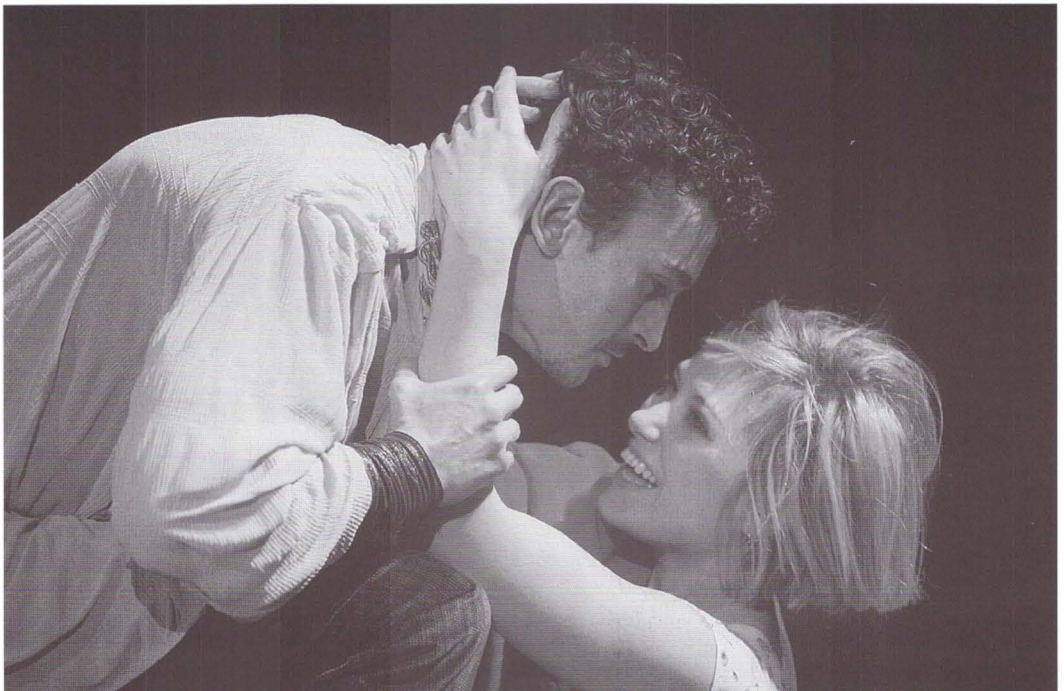
Tinerete fără bătrânețe și viață fără de moarte de Petre Ispirescu