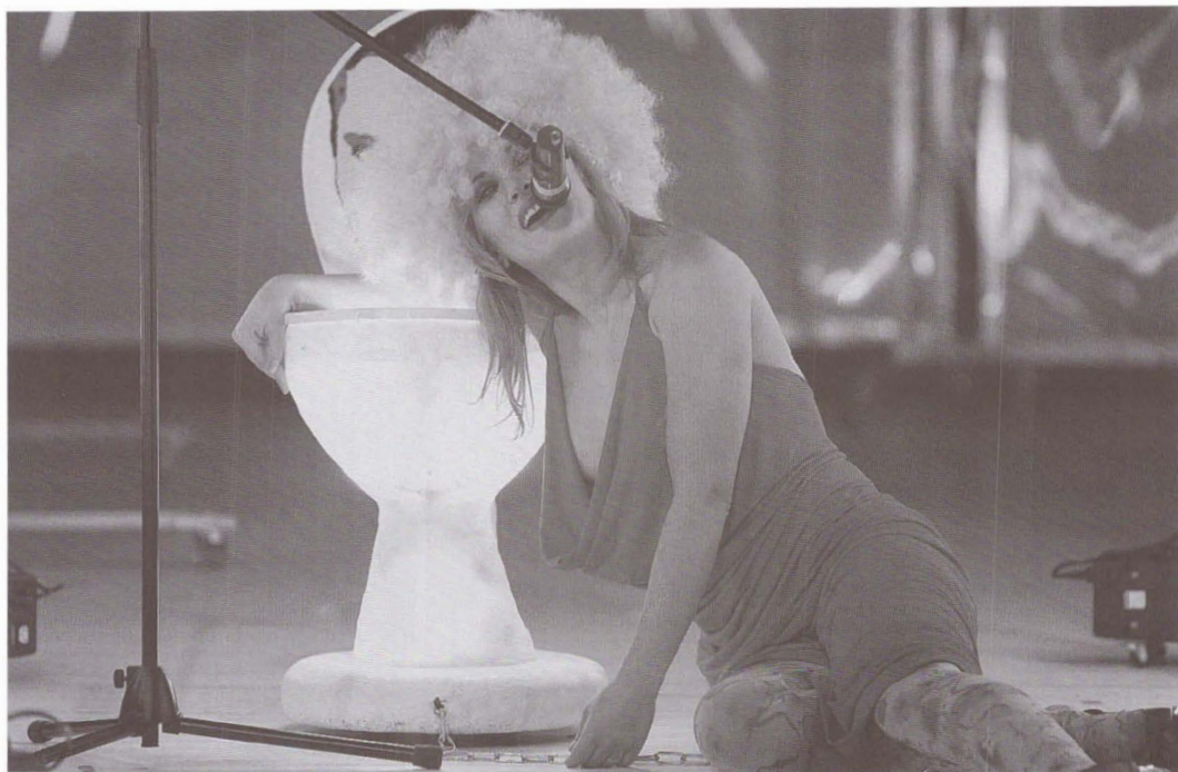
Cum traversează Barbie criza mondială de Mihaela Michailov