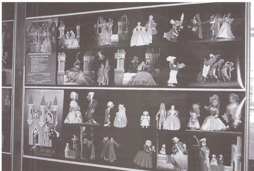
Expoziție de fotografie Cristina PEPINO