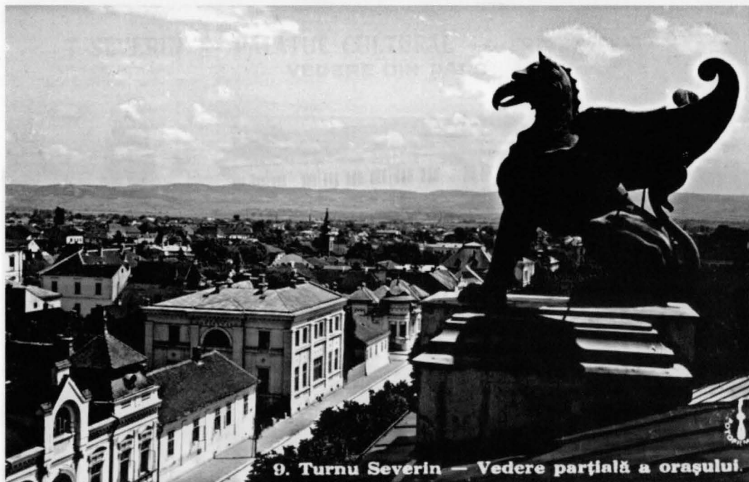
9. Turnu Severin — Vedere parțială a orașului.

general la Ministerul de industrie. Director al Liceului «Traian» din Turnu Severin. M. 25 martie/ 1939 într-un sanatoriu din București. Îngropat la Turnu Severin”.