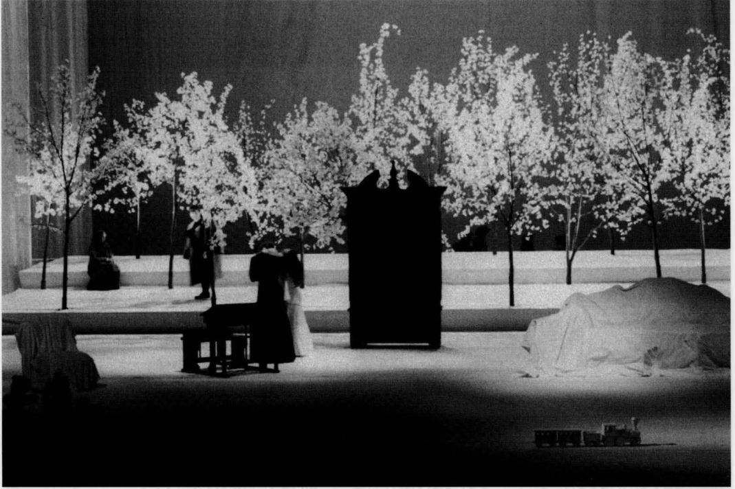
Livada de vișini , regia Andrei Șerban