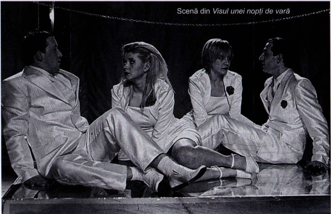
Scenă din Visul unei nopți de vară