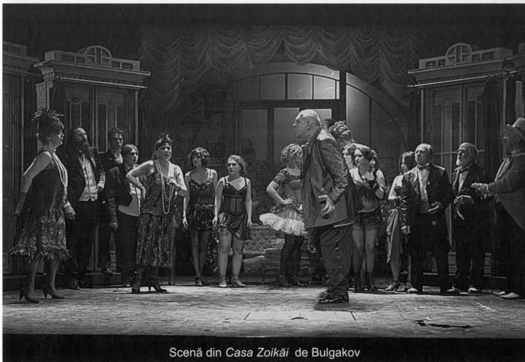
Scenă din Casa Zoikăi de Bulgakov

Am crescut într-o casă superbă, mare, cu obiecte vechi. Erau niște spații foarte frumoase în care tatăl meu a intervenit, a făcut spărturi, nișe. Aveam mai multe pisici. Părinții ne trimiteau la piață după brânză și noi ne întorceam cu un animal și fără cumpărături. Am o soră și un frate care sunt mai mari decât mine. Eram tot timpul împreună, pe atunci. Fratele meu cânta la vioară și eu la pian. Sora mea era mereu cu nasu-n cărți. Tatăl nostru era foarte sever cu noi și încerca să ne transmită cât de importantă este disciplina, în timp ce mama punea discuri cu muzică de balet, ne făcea costume și dansa cu noi. Am niște părinți foarte energici. Deseori ieșeau scânteii.