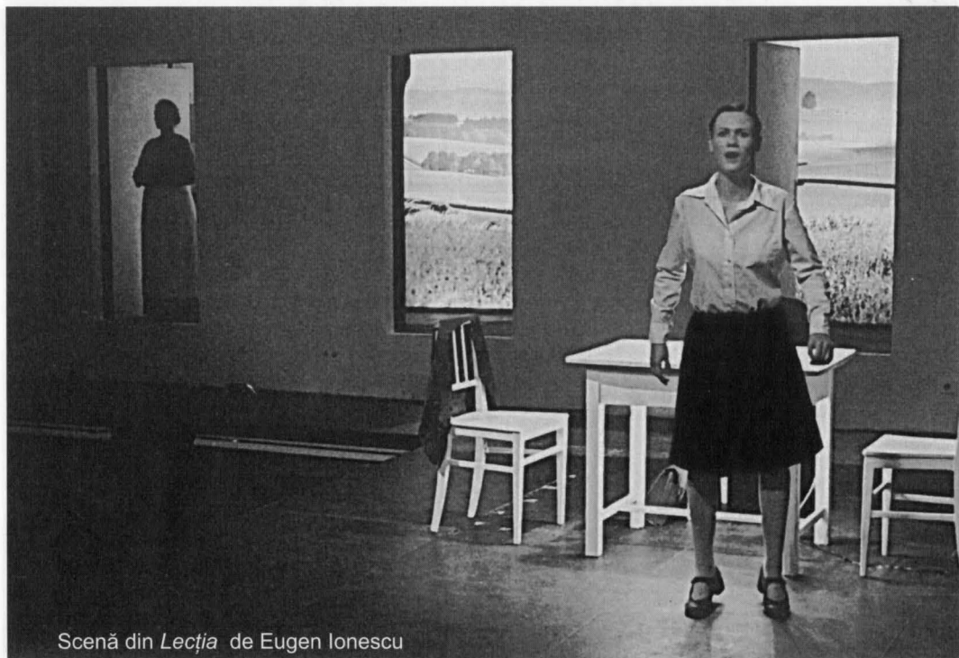
Scenă din Lecția de Eugen Ionescu

V.S.: Nu știu cum este să văd altfel, dar îmi place mult să mă plimb în lume, să mă documentez și să pun la punct proiecte de lucru, să fac fotografiile. Câteodată, încercând să prind totul, detalii, forme, culori, alăturări ciudate de lucruri din lumi sau zone diferite, nu mai reușesc să mă bucur de ceea ce văd. Sunt tot timpul cu aparatul în mână. Așa mă umplu de imagini și de frumos.