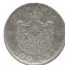
a. Aversul și reversul