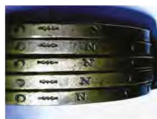
Fig. 15. Variante ale cantului cu deviză incusă la moneda de 100000 lei 1946.

Distanța minimă, 2 mm * Distanța maximă, 3,5 mm