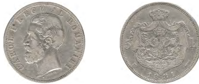
a. Aversul și reversul

Aceste monede au urmat celor din 1880 și 1881, cu titulatura DOMN, dar și celor, tot din 1881, cu titulatura REGE. Dacă aversul cu titulatura regelui fusese schimbat deja la seria anterioară 3 , la noile monede s-a mai modificat reversul (stema mai mare, fără numele țării deasupra – fig. 1/a ) și s-a renunțat la cantul zimțat în favoarea celui neted, inscripționat în relief cu deviza PATRIA SI DREPTUL MEU. Această deviză inscripționată în relief, în diverse variante, a fost ulterior utilizată la toate monedele de 5 lei argint, până în 1885, la monedele de 20 lei aur anii 1883 și 1890, respectiv la moneda de 100 lei aur din seria jubiliară din 1927 (cu milesimul 1922) 4 .