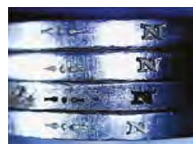
Fig. 11. Variante ale cantului cu deviză incusă la monedele de 100 lei 1943, 1944.

Distanța minimă, 2,5 mm Distanța maximă, 3,2 mm