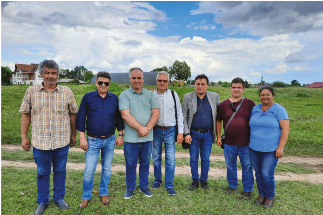
Reșca-Romula. În perioada ampaniei arheologice din anul 2021