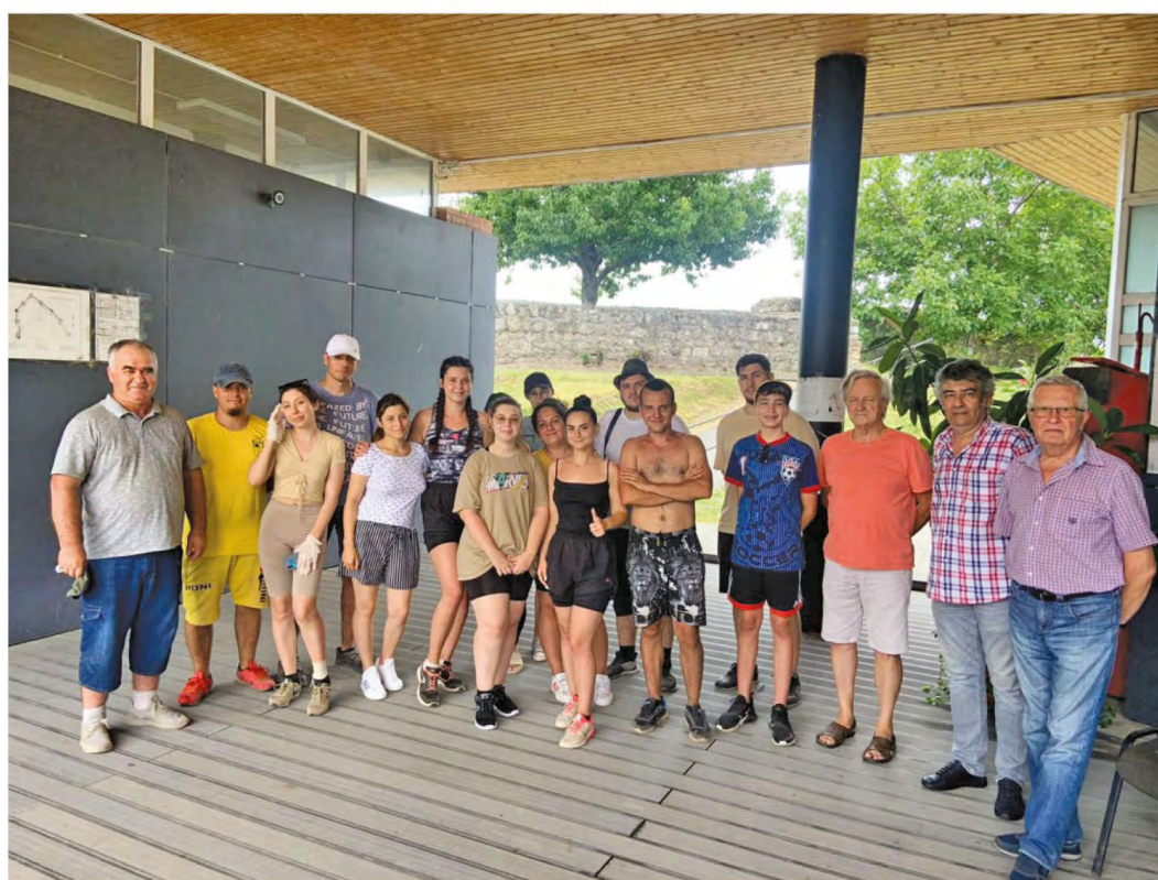
Celei-Sucidava. În perioada practicii studenților din anul 2022