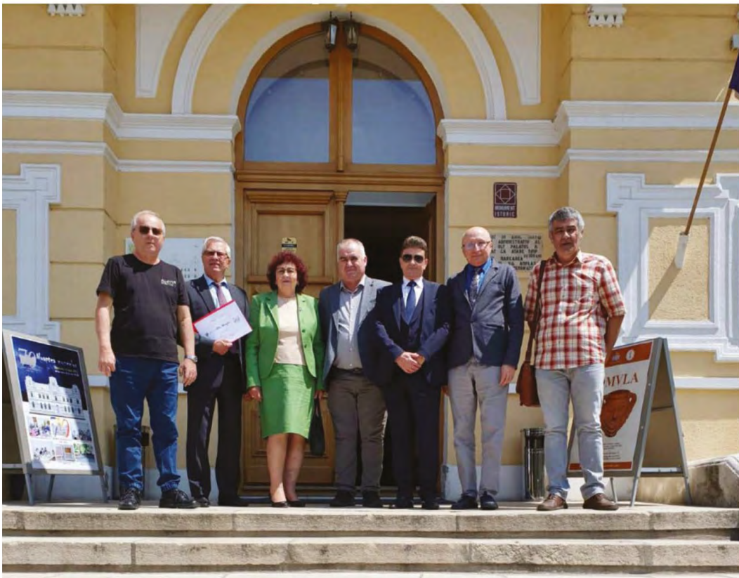
Muzeul Județean Olt, Slatina. Lansarea volumului II din Seria Romula (mai 2022)