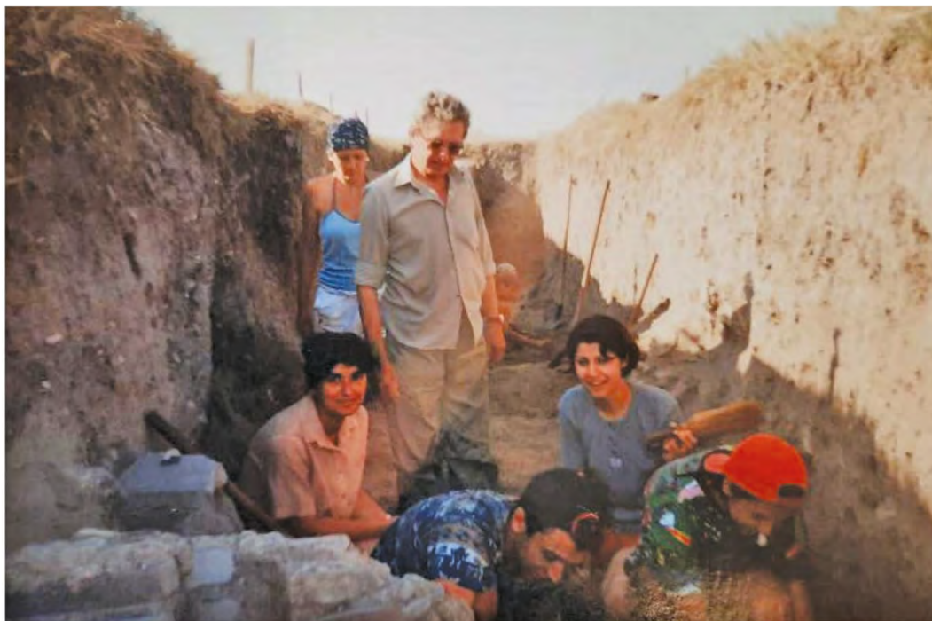
Celei-Sucidava. În perioada practicii studenților din anul 2008