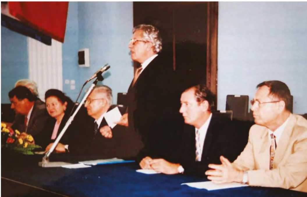
Universitatea din Craiova, „Sala Albastră”. Ceremonia de deschidere a anului universitar 2007-2008