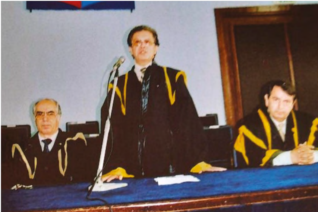
Universitatea din Craiova, „Sala Albastră”. Festivitatea de absolvire a studenților, promoția 2004