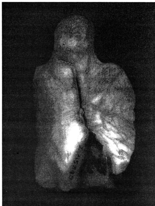
Fig. 1 Acvila romană de la Perișor, jud. Dolj/An roman eagle at Perișor, Dolj County.