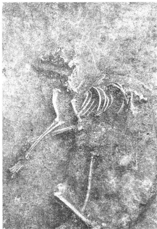
Fig. 3. Udeni. Scheletul din groapa nr. 5 in situ.

Udeni groapa nr. 5 (gr. 5). Cu ocazia săpăturilor de salvare efectuate în 1966 într-o așezare