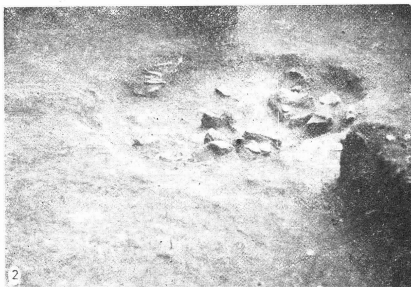
Fig. 1. Cladova. 1 vedere generală a gropilor de pe terasa 1; 2 detaliu privind groapa nr. 4.